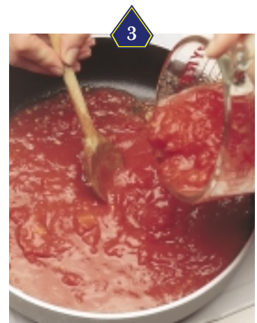
3 Dans une poêle, faire chauffer l'huile d'olive à feu moyen. Y faire fondre l'ail sans qu'il ne brunisse. Ajouter les tomates et le basilic. Saler et poivrer.