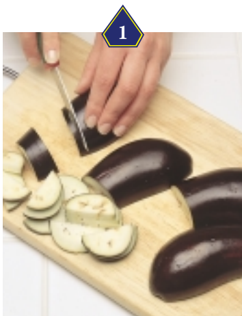
1 Laver les aubergines et les détailler en tranches minces.